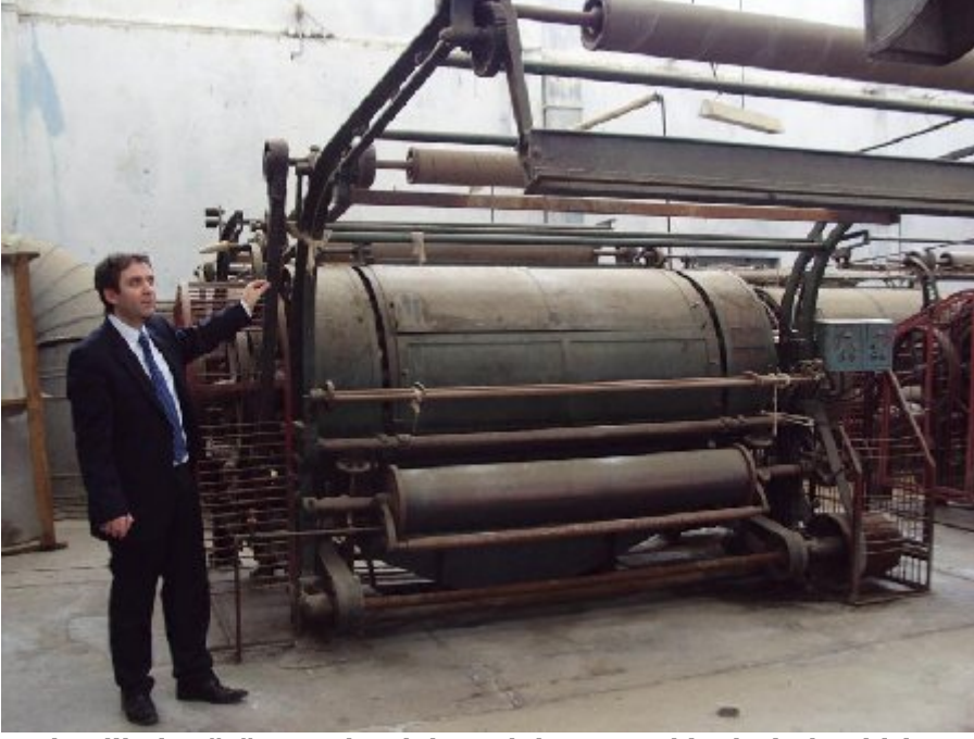
Terk edilmiş çürümeye bırakılmış dokuma makinelerinden biri