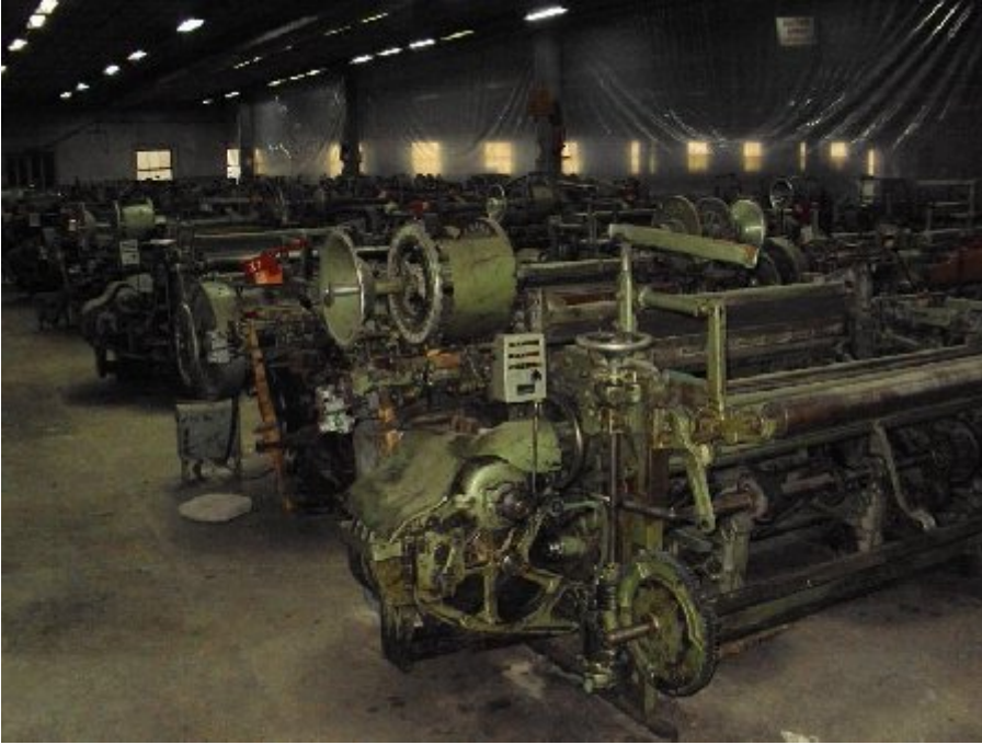
Fabrikadaki çürümeye bırakılmış makineler