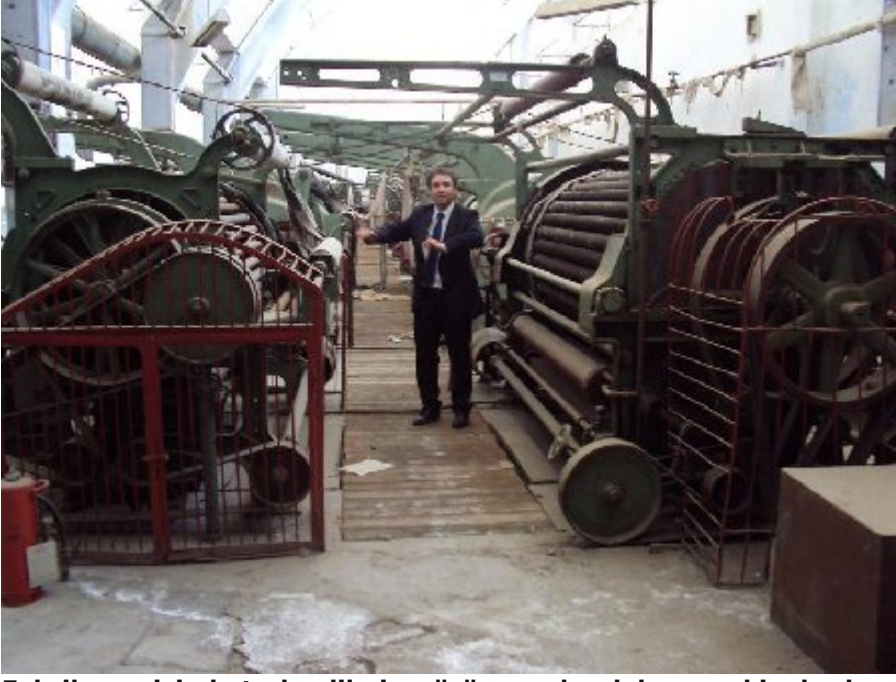
Fabrikann iinde terk edilmiř, ürümeye bırakılmıř makinelerden bir bölümü