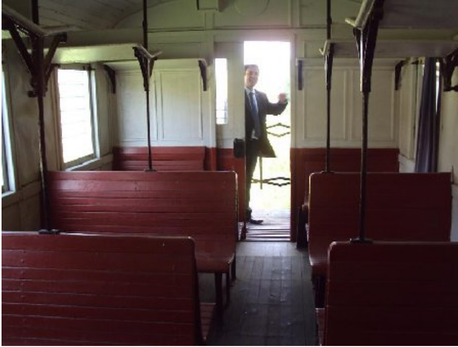
Gıdı Gıdı adlı trenin bugünkü virane hali