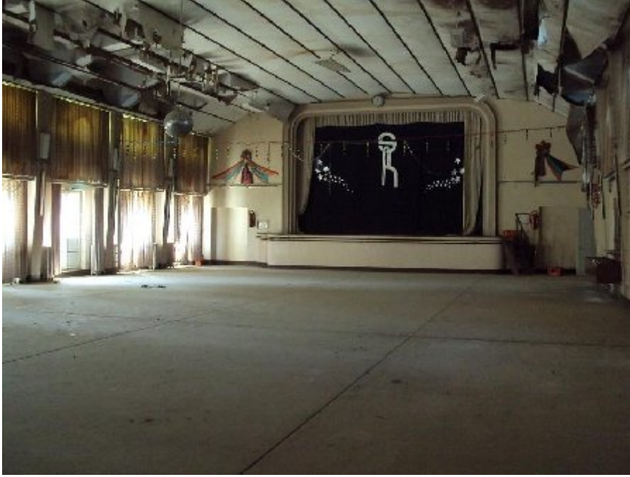
Sinema salonunun bugünkü yıkık halinden bir görünüm