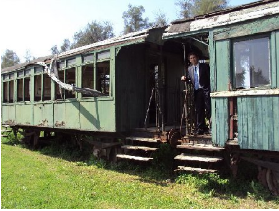
Gıdı Gıdı adlı trenin bugünkü virane hali