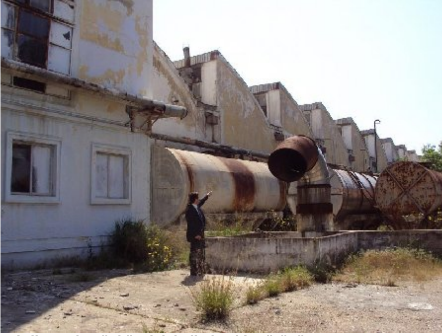
Fabrikanın bugünkü yıkık halinden bir görünüm