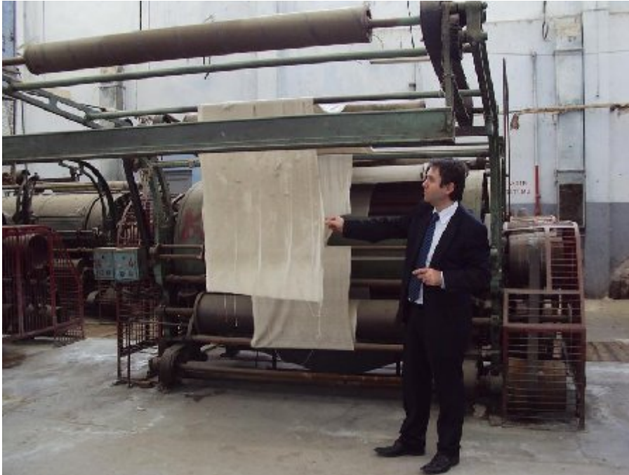
Fabrikanın içinde terk edilmiş, çürümeye bırakılmış makinelerden bir bölümü