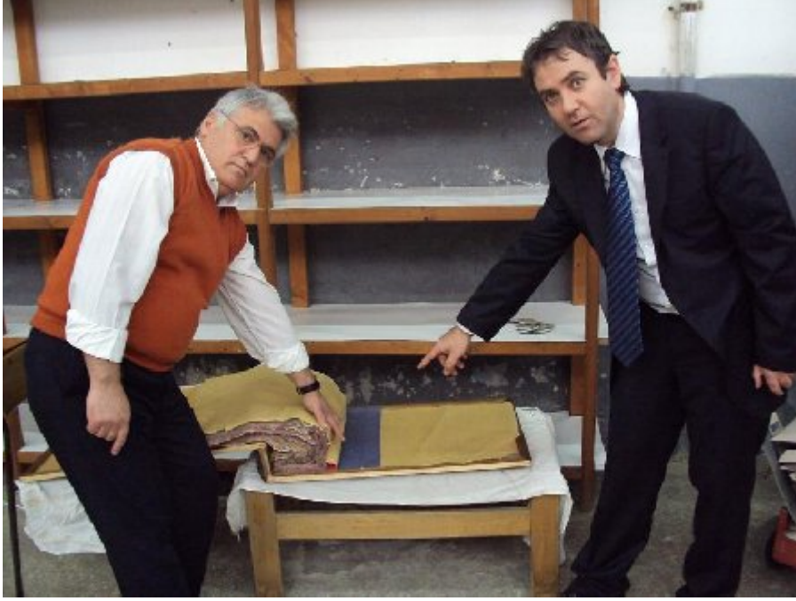
Fabrikada ilk üretilen ve bugün koruma altına kumaşlar