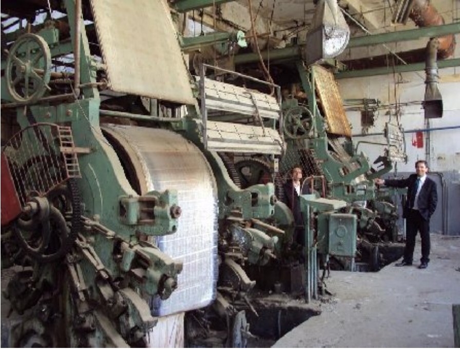
ürümeye bırakılmıř makinelerden bir görüntü