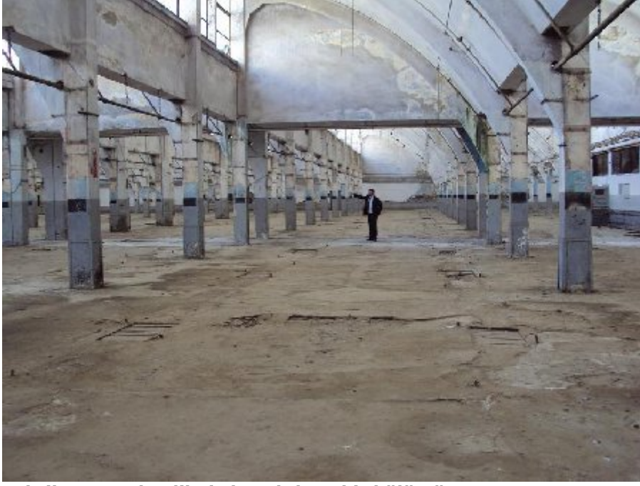
Fabrikanın terk edilmiş boşaltılmış bir bölümü