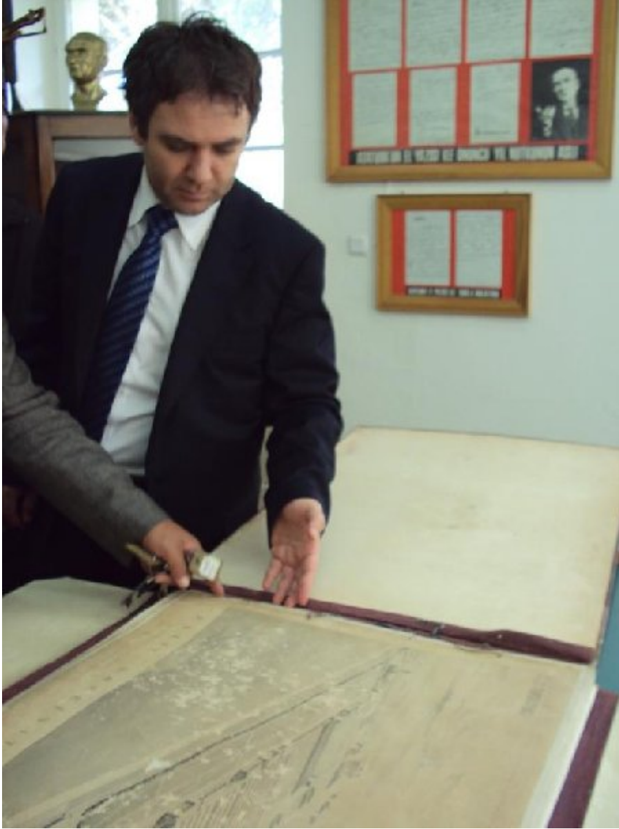
Nazilli Sümerbank Fabrikası'nın Planları