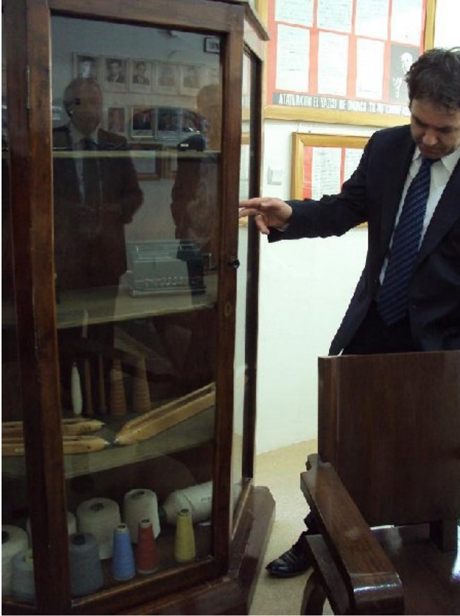
Fabrikadan bugüne kalan bazı eşyalar